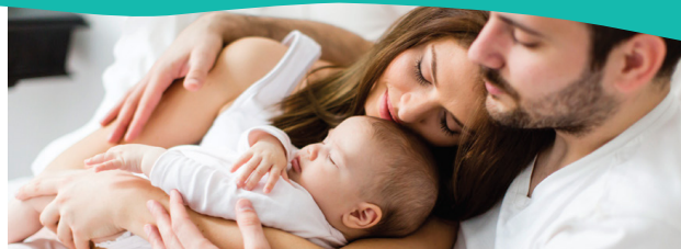
Приведенная фотография является моделью семьи с особым ребенком.

В каждой НКО создана команда из одного супервизора и пяти консультантов, которые непосредственно осуществляют домашние визиты.